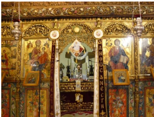
Το εντυπωσιακό ξυλόγλυπτο τέμπλο του Αγίου Γεωργίου.

τους διαστάσεις ύστερα από την έκδοση φερμανιού του Σουλτάνου.