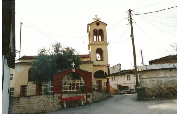
Το καμπαναριό του Αγίου Γεωργίου Η εκκλησία