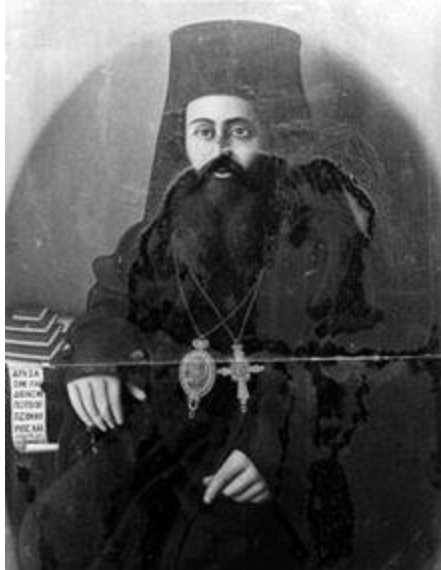
Ο Επίσκοπος Αγάπιος Βράτσης