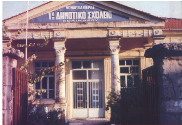
Το 1 ο Δημοτικό σχολείο