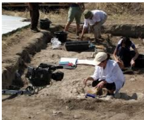
Ανασκαφές στα Παλιάμπελα.

Στο κέντρο σχεδόν του μακεδονικού τριγώνου, που σχηματίζεται το Δίον, η Πύδνα και η Βεργίνα, βρίσκεται ο Κολινδρός, κωμόπολη συνδεδεμένη με τις πιο σημαντικές φάσεις της ελληνικής ιστορίας. Το ομώνυμο δημοτικό διαμέρισμα αποτελείται από δυο οικισμούς. Οι οικισμοί είναι ο Κολινδρός και τα Παλιάμπελα. Η εξαιρετική στρατηγική του θέση, καθώς ελέγχει την πεδιάδα και τις δυτικές ακτές του Θερμαϊκού, αλλά και την κίνηση των δρόμων που διασχίζουν την Πιερία και τις διαβάσεις προς την Ημαθία, σφράγισε και τη δική του ιστορική πορεία στους αγώνες του Ελληνισμού: