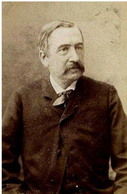
Ο γάλλος αρχαιολόγος Heuzey.

Σύμφωνα με μια ζωντανή παράδοση τον πυρήνα του συνοικισμού συγκρότησαν τον 4 ο αι.π.Χ. κάτοικοι της Πύδνας έπειτα από την καταστροφή της πόλης τους από τον Φίλιππο Β΄ πατέρα του Μεγάλου Αλεξάνδρου ή και τον εξαναγκασμό τους σε μετοικεσία στα μέρη αυτά από τον Αρχέλαο, το βασιλιά της Μακεδονίας. Την παράδοση αυτή ενισχύει η μνημειακή τοπογραφία και ιδίως οι τάφοι της ελληνιστικής εποχής (323-30 π.Χ), όπως αποδείχθηκε από τις πήλινες ή γυάλινες δακρυδόχους και τα άλλα κτερίσματα που περιείχαν. Ένας μάλιστα τάφος, που αποκαλύφθηκε το 1928 και γκρεμίστηκε για να ανοιχτεί ο δρόμος στην είσοδο της κωμοπόλεως, ήταν όμοιος με άλλους αρχαίους Μακεδονικούς τάφους, όπως αυτός που βρέθηκε στην Καρίτσα και ανάγεται στον 3 ο π.Χ. αιώνα, κατά τη γνώμη του καθηγητή Πανεπιστημίου Θεσσαλονίκης Στρατή Πελεκίδη. Επίσης, ανακαλύφθηκε και άλλος τάφος ελληνιστικής εποχής στη θέση Τσικρινά 1χλμ από τον Κολινδρό που περιείχε εκτός από τα κόκκαλα του νεκρού και δακρυδόχους και νομίσματα του Φιλίππου Β΄(359-336 π.Χ.) και του Κασσάνδρου(306-298 π.Χ.). Τέλος, έχουν βρεθεί θραύσματα αγγείων, συντρίμμια αναγλύφων, επιτύμβιες στήλες, επιγραφές, νομίσματα, βέλη, δόρατα κτλ. κατά τη θεμελίωση κτηρίων, άνοιγμα δρόμων, όργωμα χωραφιών κλπ. μέσα στον Κολινδρό και την περιοχή του τα οποία, ωστόσο, δεν μελετήθηκαν.