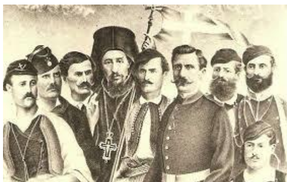
Ο Επίσκοπος Κίτρους Ν. Λούσσης