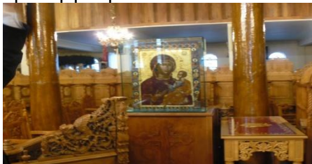
Η παλαιολόγια εικόνα δυο όψεων(στη μια πλευρά απεικονίζεται η Παναγία βρεφοκρετούσα και στην άλλη ο Χριστός κρατώντας ευαγγέλιο).

Ήταν πετρόχτιστος με ξύλο σε ρυθμό βασιλικής, ενώ είναι ιδιαίτερα εντυπωσιακό το ξυλόγλυπτο τέμπλο με αρκετά βαθύ ανάγλυφο, καθώς και οι κολώνες του ναού που είναι ατόφιοι κορμοί δέντρων 300 χρόνων. Πολλά κειμήλια υπέστησαν καταστροφή το 1878, κατά την Επανάσταση του Ολύμπου, η οποία ξεκίνησε από τον Κολινδρό με πρωτεργάτη τον Επίσκοπο Κολινδρού Νικόλαο Λούση και υπήρξε η “μαγιά” του Μακεδονικού Αγώνα.