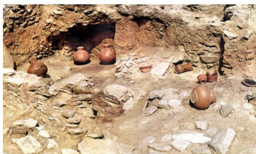
Ανασκαφές στα Παλιάμπελα